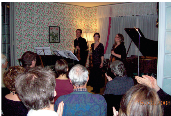
Concert du 15 mars 2008 à la Maison blanche. A droite, couverture de la partition dessinée par Le Corbusier.