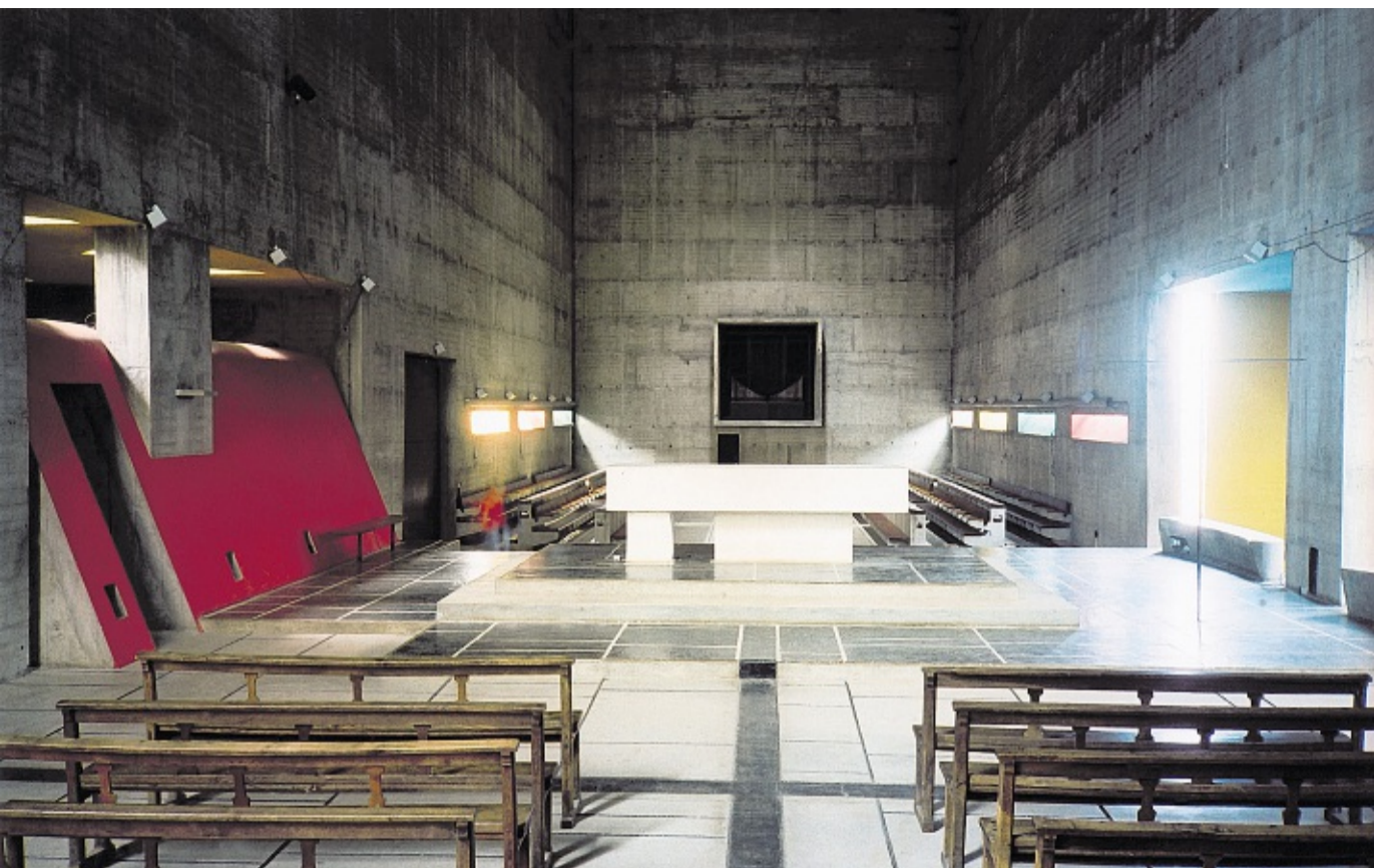
☐ Couvent Sainte-Marie de La Tourette, près de Lyon (Rhône), construit en 1960.