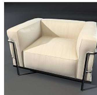
☐ Fauteuil LC2 (1928).