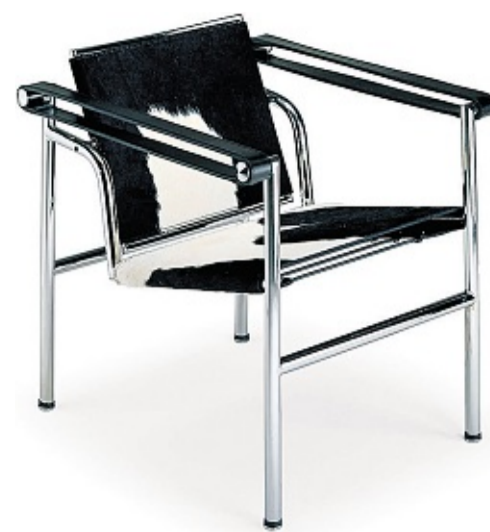
☐ Fauteuil basculant LC1 (1928).

C'est également le cas de ces plasticiens (Peter Doig, Alain Bublex, Kader Attia, Pierre Huyghe, Tom Sachs, Rirkrit Tiravanija, Thomas Hirschhorn, Olaf Nicolai, Simon Starling, Georges Sanchez Calderon) qui tiennent Le Corbusier non pour un architecte mais pour un artiste protéiforme dès lors que meubles, immeubles, maisons, peintures, photos, collages, estampes, sculptures forment une continuité. Un peu partout, chacun s'en empare, s'en nourrit, le réinterprète.