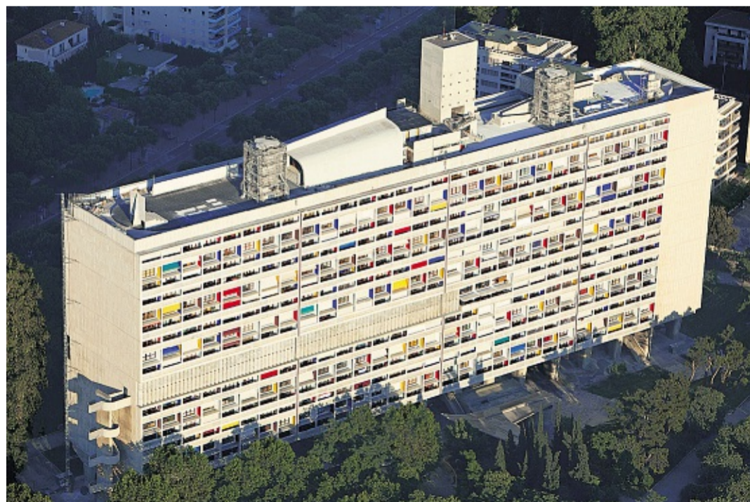
☐ La Cité radieuse, unité d'habitation construite à Marseille en 1952.

Il est loin le temps où les Marseillais l'appelaient « la maison du fada ». D'autant qu'à bien des étages les bobos ont succédé aux prolos. Mais ce sentiment de solidarité et d'identité collective se retrouve dans d'autres villes, par exemple à Pessac, où les habitants de la Cité Frugès ont entrepris un grand mouvement de rénovation. ▶▶▶