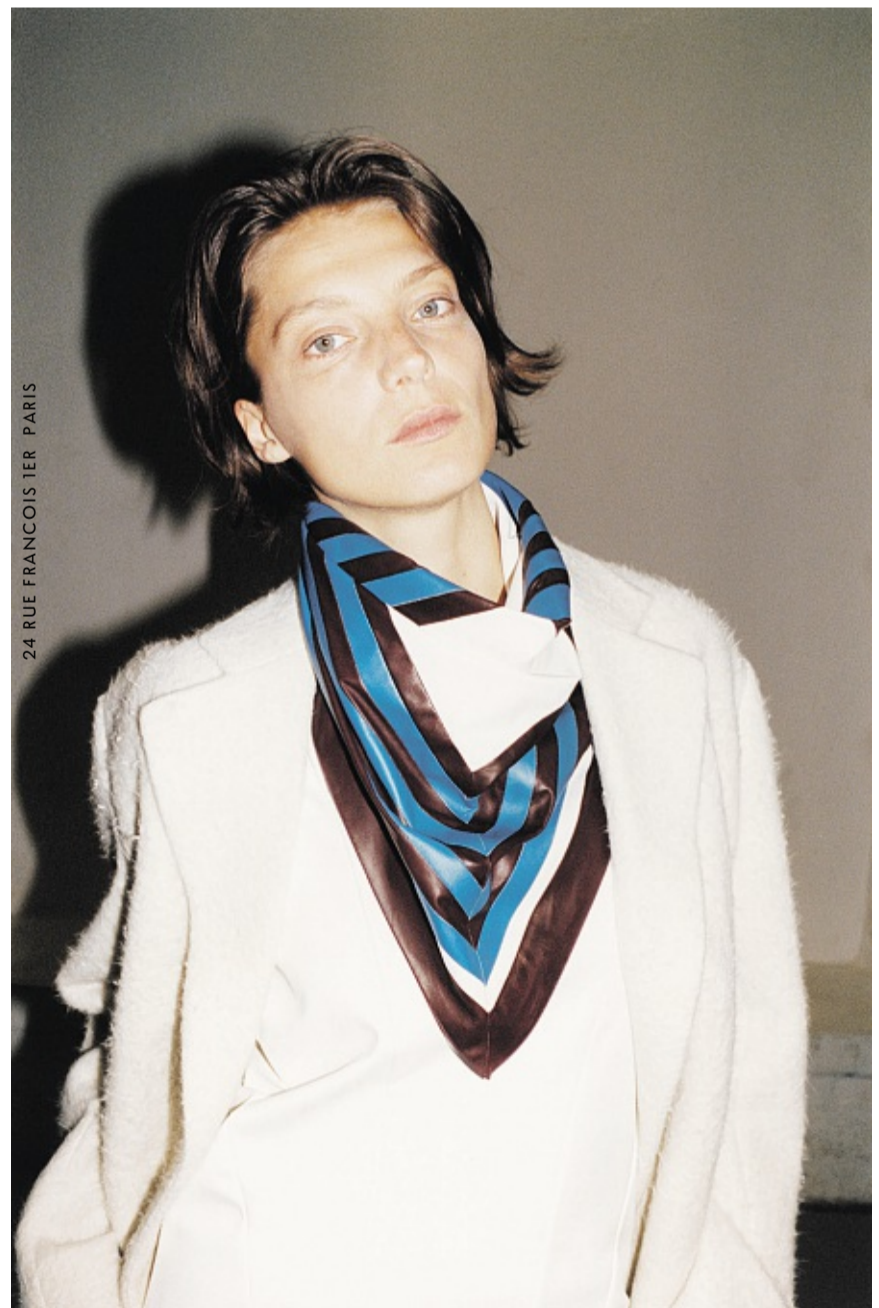
24 RUE FRANCOIS TIER - PARIS