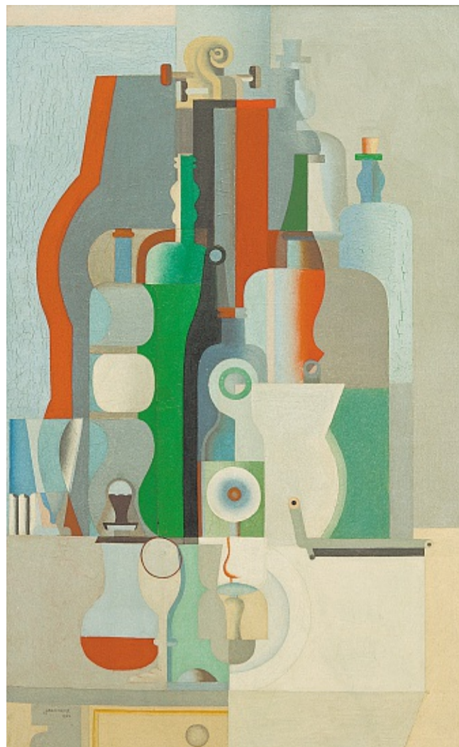
« Nature morte verticale I » (1922), huile sur toile.

En fait, tout bute sur un écueil : le caractère transnational de la candidature, car les bâtiments en question sont dispersés sur six pays (France, Suisse, Argentine, Japon...) et trois continents. L'Icomos s'est donc inquiétée d'une gestion nécessairement acrobatique du