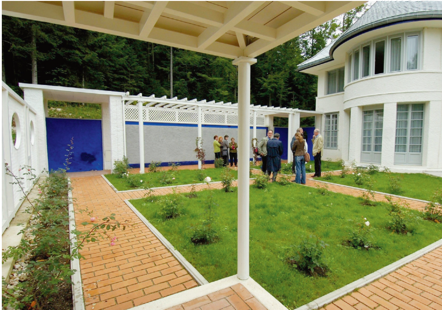
La Maison blanche est la première œuvre individuelle de Charles-Edouard Jeanneret, qui ne s'appelait pas encore Le Corbusier.

D'autres éléments plaident en défaveur de l'immeuble chaux-de-fonnier. «Le Corbusier lui-même n'avait pas inscrit ce bâtiment dans son œuvre complète.» En revanche, les deux autres objets suisses – la petite maison de Corseaux et l'immeuble Clarté à Genève – ont, eux, été reconnus par le maître. «Dans ces conditions, je ne suis pas certain que la