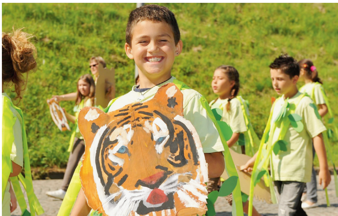
En tout entre 700 et 800 enfants, des écoles infantine et primaire, défilent pendant le cortège des Promos au Locle, samedi prochain.